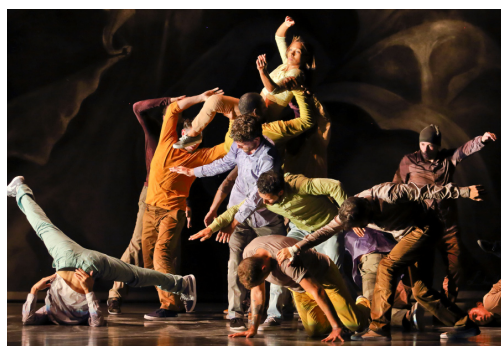
Figure majeure du hip hop français, Kader Attou présente un ballet pour 16 danseurs d'excellence. Puissance acrobatique et délicatesse émotive dessinent les pas de l'individu, la chorégraphie d'un « être ensemble ». Une danse d'une beauté vertigineuse et sensuelle.